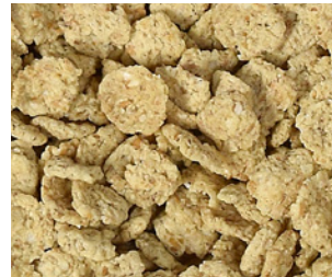
Flakes Birnensaftkonzentrat mit Zimt